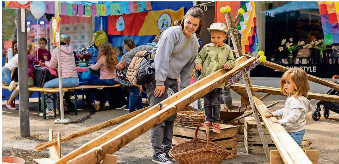
Der Anlass erfreut sich einer grossen Beliebtheit bei den Kindern und Familien.

Die Kreuzlinger Spielstrasse findet traditionell Ende September auf dem Kreuzlinger Boulevard statt. Der Anlass erfreut sich nach wie vor einer grossen Beliebtheit bei den Kindern und Familien. Die lokalen Vereine und Institutionen tragen den Event mit grossem Engagement mit und nutzen diesen als Plattform, um ihr Angebot bekannt zu machen. Am 21. September mit dabei sind rund 40 Vereine, Institutionen, Gastronomen, und Vertreter des ansässigen Gewerbes. Viele von ihnen machen seit vielen Jahren an der Spielstrasse mit, es gibt aber immer auch neue Anbieter, die sich dem Kreuzlinger Publikum präsentieren. Kindergeschichten, Närrisches, Pizza backen und das Thema Schlagzeug gibt es