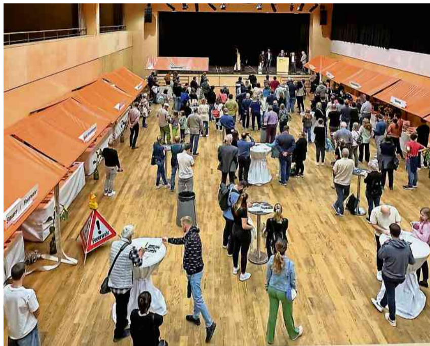
Munterer Austausch am Willkommens-Apéro mit Neuzuzügerinnen und Neuzuzüger.