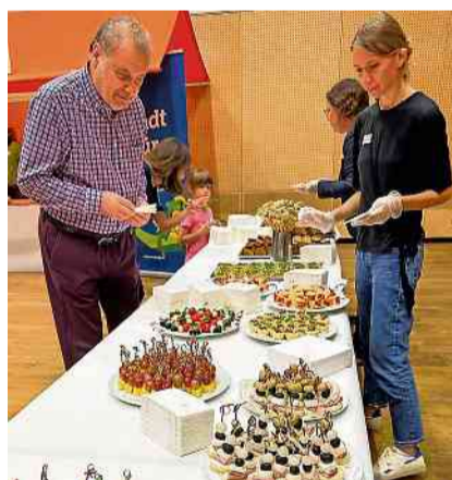
Ukrainischen Flüchtlinge bereiten ein buntes Buffet vor.