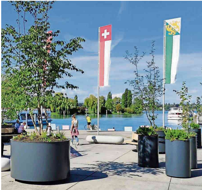
Die Stadt-Insel am Hafensplatz.

Redaktion: Kreuzlinger Nachrichten, Tel. 071 677 08 86, E-Mail: amtliches@kreuzlinger-nachrichten.ch