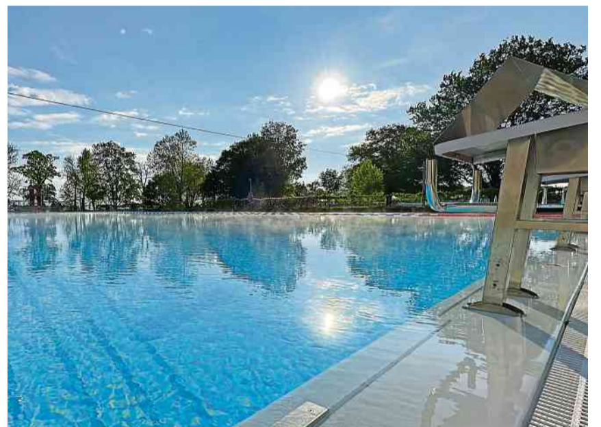
Allen Badegästen besten Dank für die Treue und bis im 2025!

Nach jahrzehntelangem Engagement der Genossenschaft Hörnli, übernahm die Stadt Kreuzlingen per 1. Januar 2024 die Betriebsführung der Gesamtanlage. Die erste Saison unter Federführung der Stadt endet am Samstag, 14. September, um 19 Uhr. Der Saisonstart musste erstmals in der Geschichte des Schwimmbads Hörnli um eine Woche auf den 4. Mai aufgrund der tiefen Temperaturen verschoben werden. Während der Wintermonate wird das Bad fit für die Saison 2025 gemacht. Der Seezugang zum Steg ist Montag, ab 16. September wieder geöffnet. IDSK