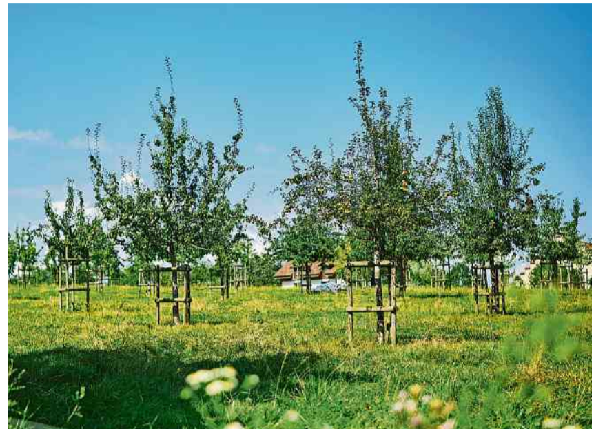
Vor dem Verschwinden gerettet: Alte Obstsorten im Seeburgpark.

Allesamt sind es alte Kultursorten, die bis vor einigen Jahrzehnten in unserer Region verbreitet waren. Heutzutage erfüllen sie die Bedingungen für Grossmärkte nicht mehr. Viele der Sorten sind sehr selten geworden, manche konnten sogar erst im letzten Moment vor dem Verschwinden gerettet werden. Urs Müller, Pomologe und ehemaliger