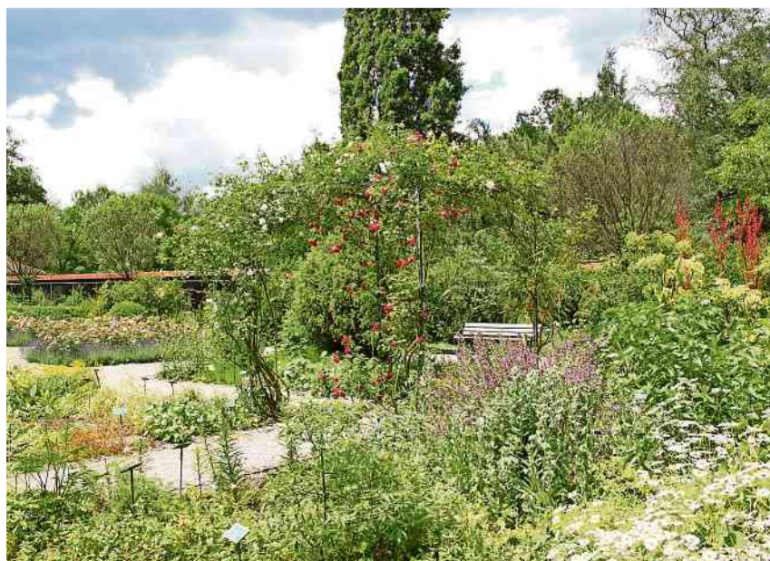
Judith Degen führt am 20. September letztmals durch den Kräutergarten.

Der Kräutergarten im Seeburgpark ist einer der schönsten und spannendsten in der Ostschweiz. Während der Vegetationszeit führt Judith Degen, Gärtnerin und Kräuterefachfrau, monatlich durch den Garten und erzählt über die zahlreichen Pflanzen, ihre Geschichten und deren Nutzen in der Volksheilkunde. Die letzte Führung in diesem Jahr findet am Freitag, 20. September, 18.30 Uhr, statt. Bei Dauerregen findet die Führung nicht statt. Bei unsicherer Witterung erteilt das Sekretariat der Bauverwaltung zwischen 13.30 und 16 Uhr Auskunft über die Durchführung: 071 677 63 81. IDSK