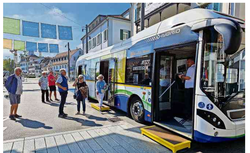
Interessierte Besucherinnen und Besucher am Busjubiläum.