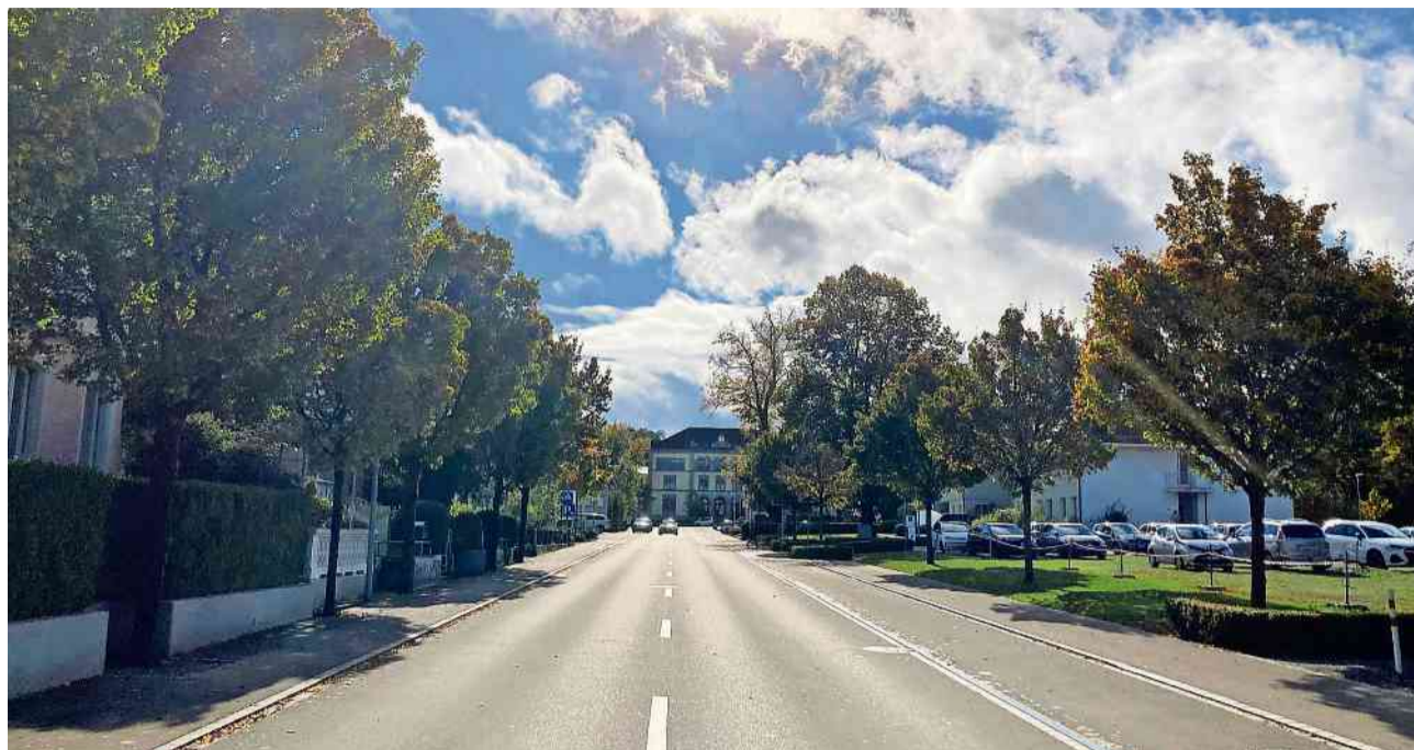
Der südliche Teil der Bahnhofstrasse: Teil des Perimeters einer übergeordneten strategischen Zentrumsplanung.

Viel Arbeit auf, an und in Strassen Die erwähnten Bereiche befinden sich nur bedingt im Einflussbereich von Gemeinderat und Verwaltung. Wie bereits in den Vorjahren wird unsere Organisation intensiv von den zu erbringenden Dienstleistungen