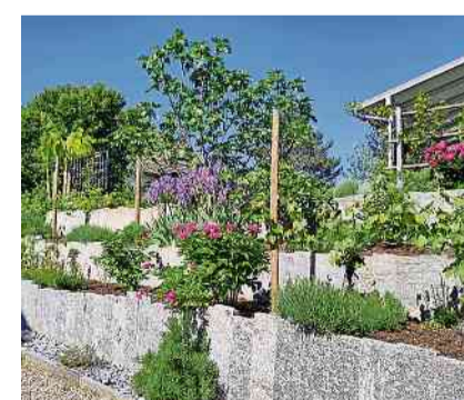
In Tägerwilen können am Sonntag nochmal Gärten besichtigt werden.

Tägerwilen Bei einer Gartenbesichtigung begegnen sich Menschen, die ihre Gartenleidenschaft, ihr Wissen und praktische Erfahrung mit einander teilen. Einblicke in fremde Gartenanlagen bieten Anregung für das eigene gärtnerische Schaffen und Inspiration zu ausgefallenen Bepflanzungen und künstlerischer Kreativität. Mit neuen Gartenfreunden werden Pflanzen geteilt, Entdeckungen über Gartenliteratur und Gärtnereien ausgetauscht. Kommenden Sonntag, 26. Mai, sind in Tägerwilen und Konstanz nochmals drei private Gärten geöffnet. In